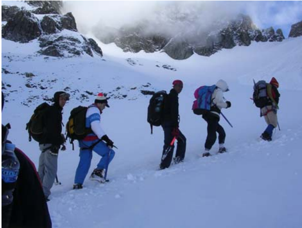
Et toujours la volonté d'aller plus haut ...