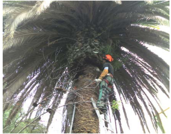
Les chantiers Pro issus du chantier d'insertion, le dernier maillon avant l'accès ou le retour à l'emploi.