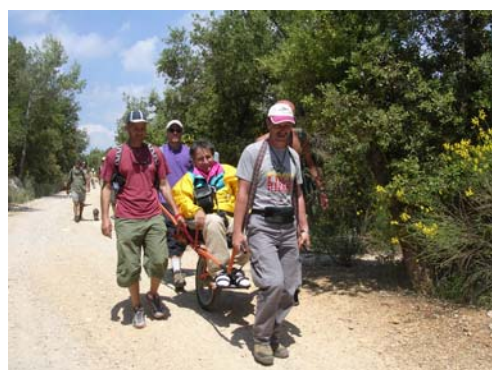
Sortie Joëlette, les débuts du projet Montagne Handicap